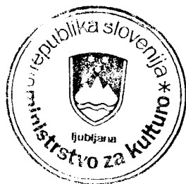
Majda Širca, ministrica

S prepričanjem, da vam bo navedeno lahko koristilo pri oblikovanju vašega predloga ključnih prioritet v kulturni politiki naslednjih let, ki ga boste posredovali predsedniku vlade, vas lepo pozdravljam.